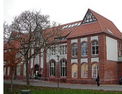
Raum für Kunst: Das Atelierhaus im Kieler Ansharpark. RÖNNAU

ner Gröschl, der in einer buntschillernden Barriere seine „aktion gegen brotlose Kunst!“ startete, womit er zum Nachdenken „über den Wert sowie die Qualität künstlerischer Arbeit“ anregen möchte. In nummerierten Tütchen konnte jeder Besucher eine Scheibe trockener Brot mitnehmen. Als Trost gab es nebenan aber dann ein saftigeres Buffet – gesponsert von verschiedenen Kieler Unternehmern und Ein-